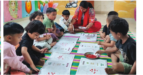
બાળકનું વિવિધ પ્રવૃત્તિમાં સમાવેશ