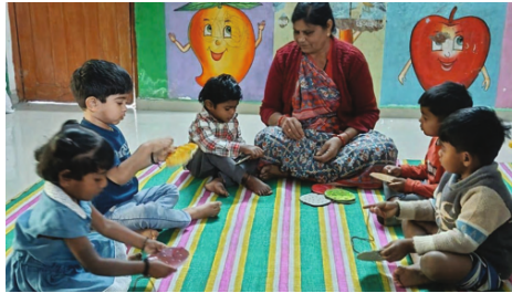
અન્ય બાળકો સાથે પરોવણીકામ કરતું બાળક